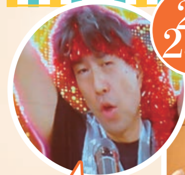
巨大スクリーンで登場 華麗なるダンスを披露