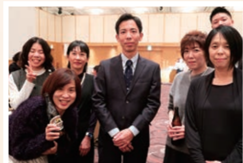
理事長の一引きで ペアの温泉宿泊券を獲得